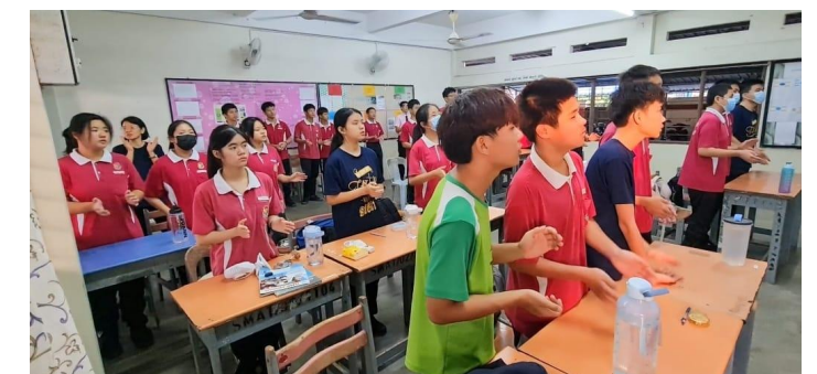
“Saya telah berjaya meningkatkan tahap kepimpinan AJK ISCF. Aktiviti persatuan berjalan lebih lancar. Pelajar lebih aktif menyertai aktiviti persatuan.”