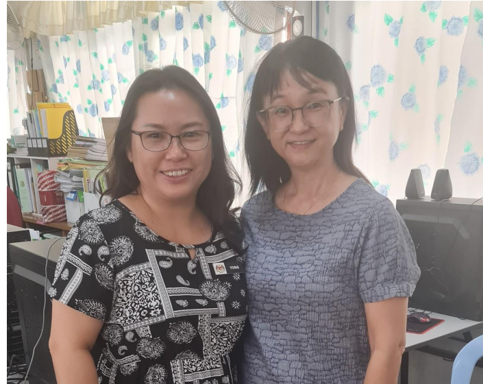
Perbincangan dengan Buddy, Puan Thien untuk mendapatkan maklum balas tentang Model Logik dalam KMTS.