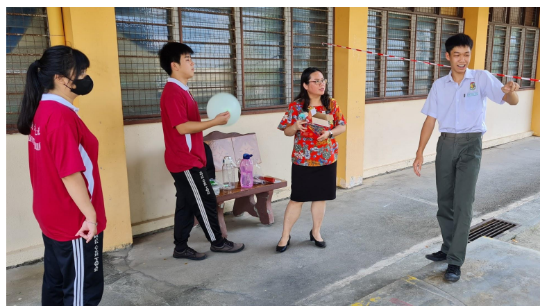
Sesi latihan kepada AJK sehari sebelum aktiviti.