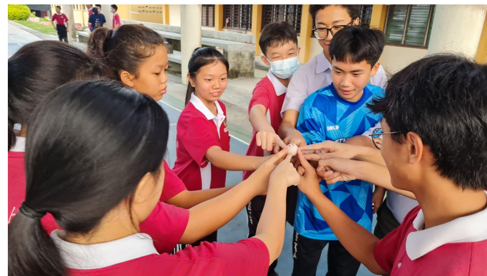
5 orang AJK mengambil peranan sebagai pemimpin kecil untuk Aktiviti Telematch pada 25/6/2025