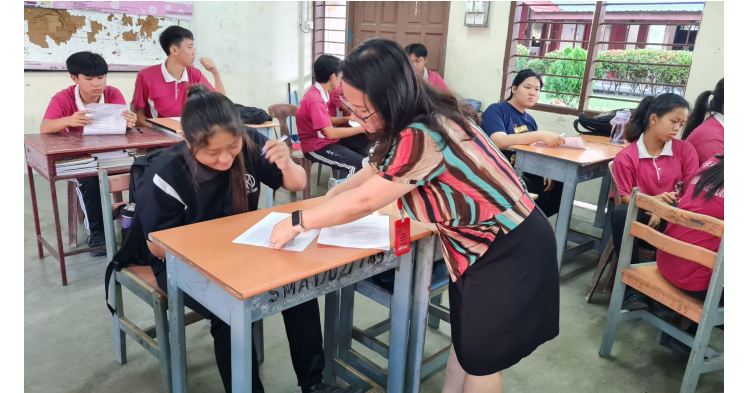
Kutipan Data Akhir