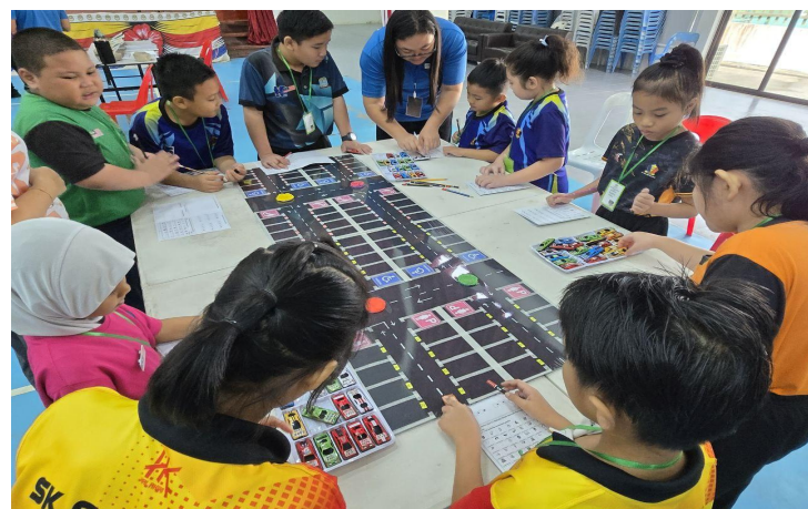
Stesen "Add & park"