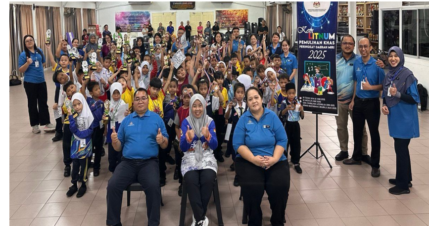
Majlis penutupan di Kem 2