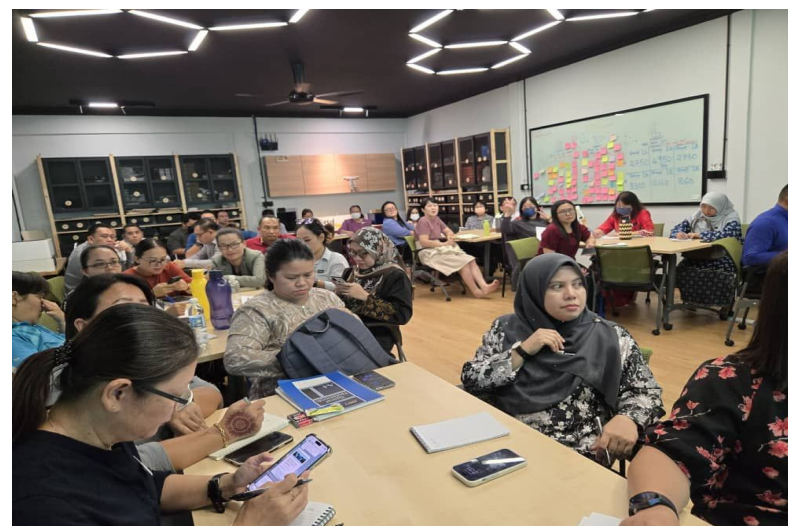
SLU bersama Penolong Kanan 1 sekolah