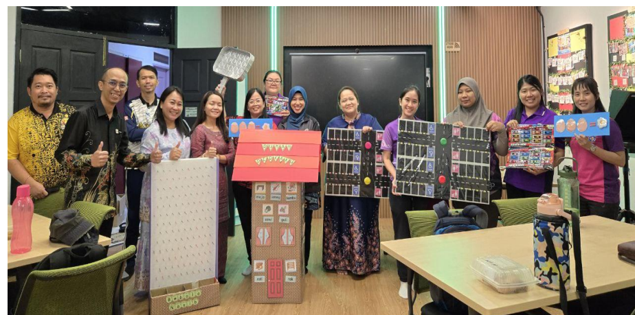
Bengkel Pembinaan Peralatan Kem