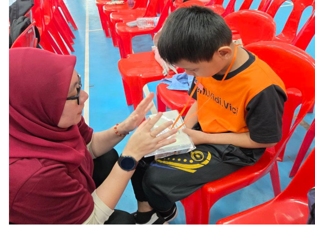
Peserta MBPK autisme