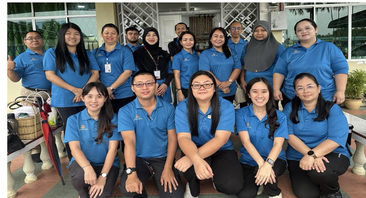
Think Tank team Pemulihan Khas PPD Miri