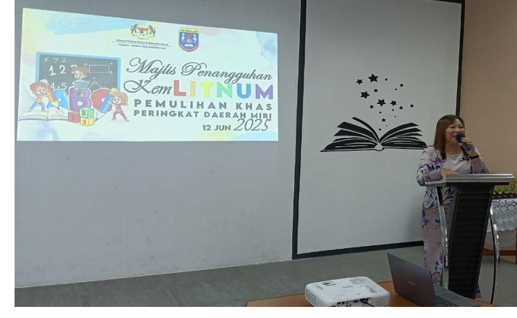
Sokongan padu dari GB