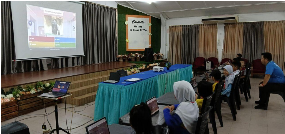
Stesen Kahoot di Kem LitNum 2