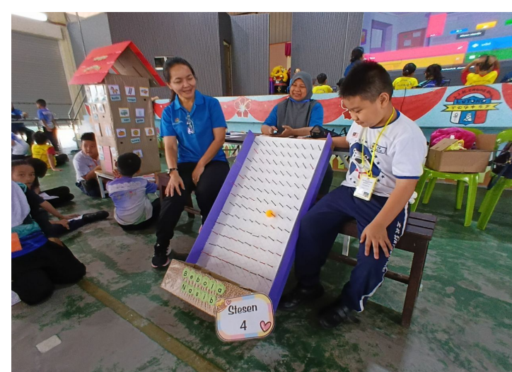
Stesen Bebola Nasib Rumah Perkaku