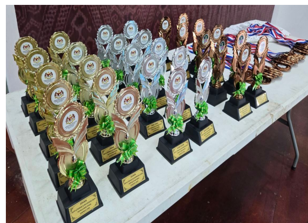
Untuk semua peserta